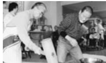
さあ これから つきますよ