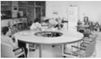
一階西食堂共有スペース

改修の結果、一階にユニットケアよりやや人数が多い東館十六名、西館二十四名の二グループを作る予定です。東館、西館に