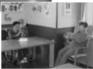
お誕生日のお祝い

家庭の延長がみのりであるように、起きたい時が起床、趣味がある方は余暇の時間、入浴したい時が入浴時間というように、入居前のリズムを崩さないように、利用者の意思を最大限尊重しています。ぜひ一度、みのりへ来てみてください。問い合わせは45-7000まで。